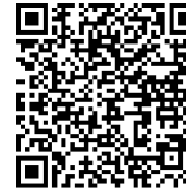
QR-Code der Anmeldeseite

Post: Landesärztekammer Brandenburg Akademie für ärztliche Fortbildung PF 101445 03014 Cottbus