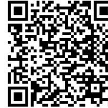
QR-Code der Anmeldeseite